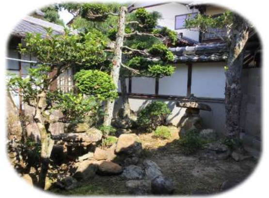
↑小瀨の中庭 小瀨に迎えるお客様の ため、明治時代に 作られました。